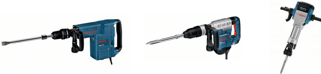
Mietpreise in EURO pro