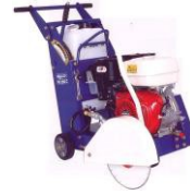
Mietpreise in EURO pro