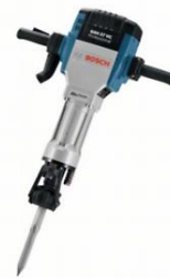
Mietpreise in EURO pro